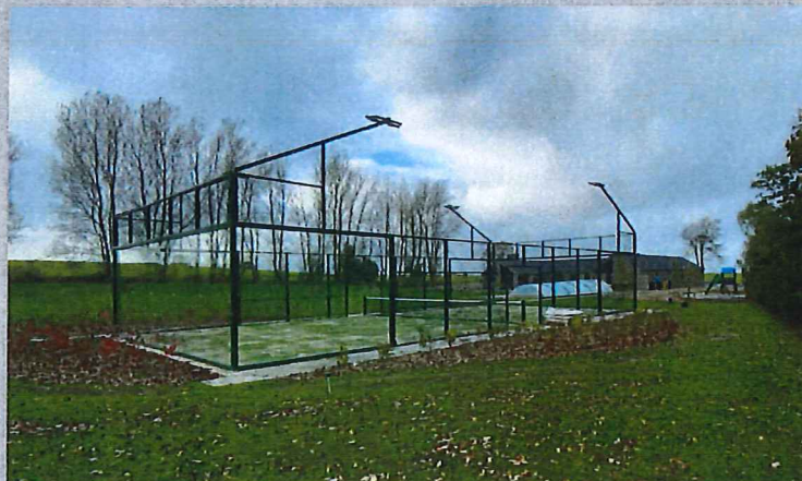
Privat opførsel af 1 udendørs panoramabane på Fyn oktober 2020