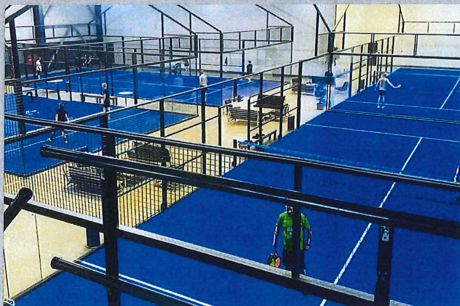
4 indendørs panoramabaner opført i My Padel Club i Slagelse juni 2019